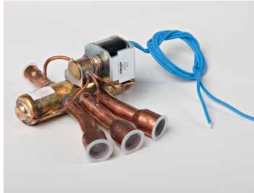
Art. 925 - Four ways valve with 230V/1 coil (603NT) Valvola inversione ciclo con bobina (603NT)