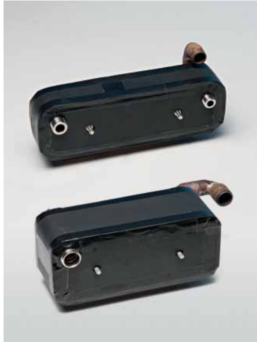
Art. 891 - Heat exchanger for sea water for chiller Series 410 - art. 602NT Scambiatore acqua mare per chiller serie 410 - art. 601NT