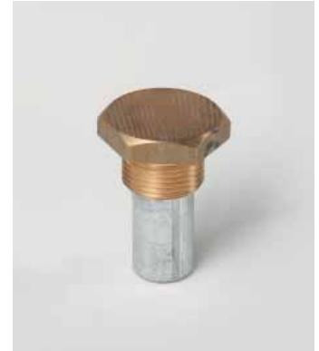
Art. 912 - Thread / Filetto 3/4" for HP 0,75-1,2-1,5-2-2,5