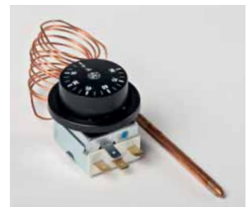
Art. 904 - Heat thermostat / Termostato caldo