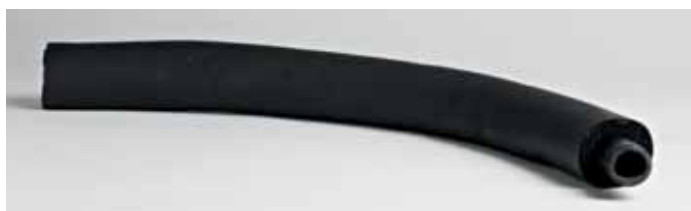
Rubber pipe 10bar with neoprene insulation, various diameter. Tubazione in gomma telata 10bar con rivestimento in neoprene Ø vari.