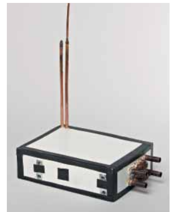
Art. 899 - Heat exchanger for sea water (unit HP 0.75) / Scambiatore acqua mare per centralina HP 0,75 - 9800