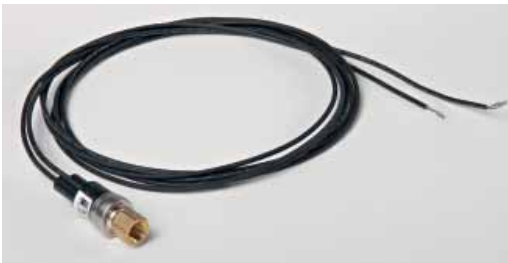
Art. 928 - Pressure switch HP - autoreset (601-602-603NT) Pressostato HP autoreset (601-602-603NT)