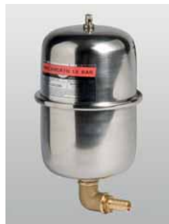
Art. 629 - 2 Lt. Art. 624 - 20 Lt. Inox expansion tank / Vaso d'espansione