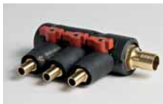
Art. 635 - 2 vie / way Art. 636 - 3 vie / way Art. 637 - 4 vie / way Art. 638 - 5 vie / way Bronze insulated fancoil water distribution manifold with taps. Collettore distribuzione in bronzo coibentato per acqua trattata circuito fancoil, completo di rubinetti di intercettazione.