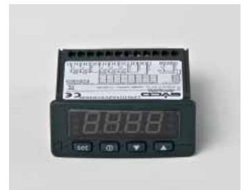
Art. 921 Electronic controller C-PRO (601-602-603NT) Controllore C-PRO (601-602-603NT)