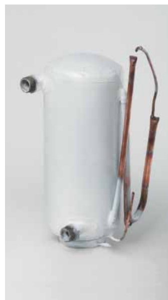
Art. 900 - 32500-39000 / (unit HP.2-HP.3) Art. 900/a - 65000-78000 / (unit HP.4-HP.5) Art. 902 - 10000-26000 / (HP.1-HP.1,5) Heat exchanger for sea water. Scambiatore acqua mare per centraline