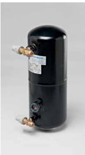
Art. 535 R22 Gas Tank With Liquid Indicator And Taps Kg.4 Serbatoio Gas R22 Con Spia e Rubinetti Kg.4