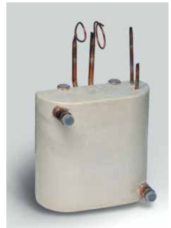
Art. 892 - Heat exchanger for sea water and for fresh water for chiller Series 410 - art. 603 NT Scambiatore acqua dolce e acqua mare per chiller serie 410 - art. 603NT