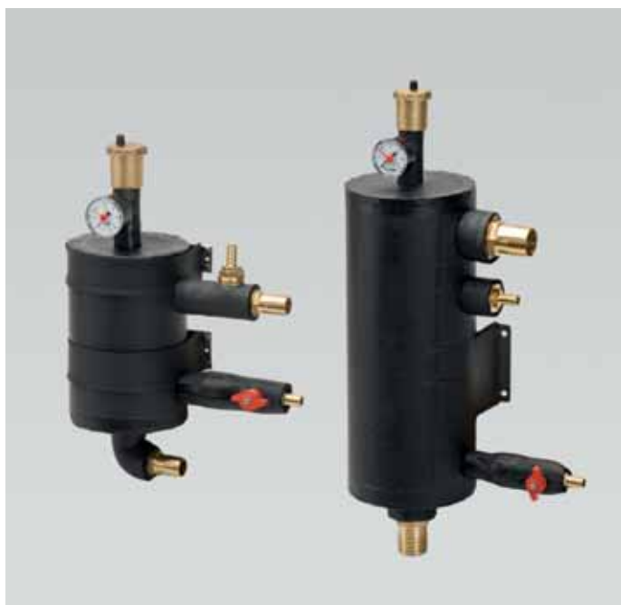
Art.630 - 2 Lt. Art.631 - 3 Lt. Art.632 - 7 Lt. Stainless steel insulated air bleeding tank with charge tap, manometer and automatic centralized air bleeder. Serbatoio separatore aria inox coibentato completo di rubinetto di carica, manometro e spurgo aria automatico centralizzato.