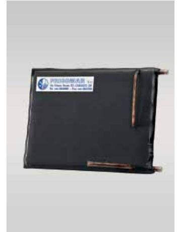
Art. 890 - Heat exchanger for sea water for chiller Series 410 - art. 601NT Scambiatore acqua mare per chiller serie 410 - art. 601NT