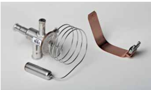
Art. 923 Expansion valve R410a (603NT) Valvola espansione termostatica R410a (603NT)