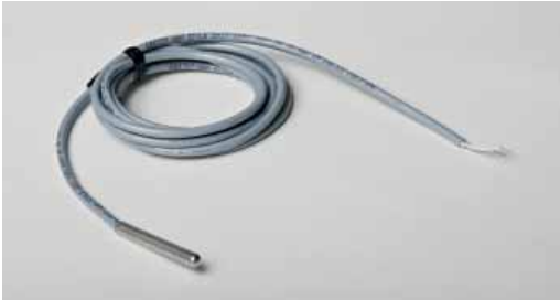
Art. 920 - Temperature probe for electronic controller FX06 (601-602-603NT) / Sonda temperatura per FX06