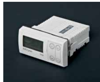
Art. 919 Electronic controller FX06 (601-602-603NT) Controllore FX06 (601-602-603NT)