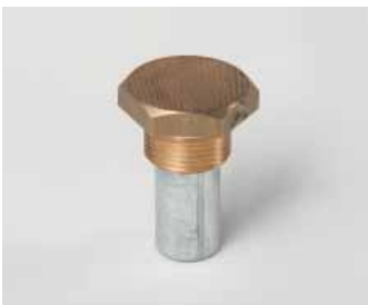
Art. 912 - Thread / Filetto 3/4" for HP.0,75-1,2-1,5-2-2,5