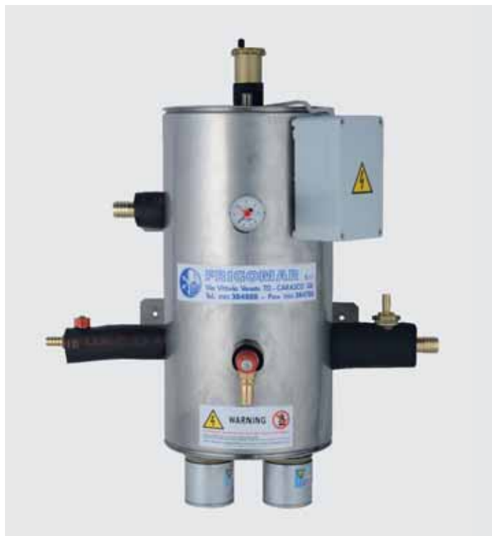
Art. 610 - Boiler 25 lt. Art. 611 - Boiler 50 lt. Stainless steel electric heater for the heating of the fan coil closed water circuit when it is not possible to make use of the heat pump. Available in both single and three phase and multi-step. Boiler realizzati in acciaio inox con resistenze elettriche corazzate per il riscaldamento dell'acqua nel circuito chiuso fancoil quando non è possibile utilizzare la pompa di calore. Disponibili sia con alimentazione monofase che trifase ed azionamento a gradini.