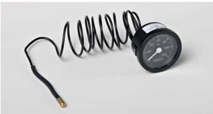
Art. 911 Thermometer / Termometro