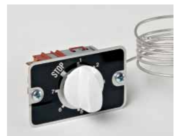
Art. 905 - Cold thermostat / Termostato freddo