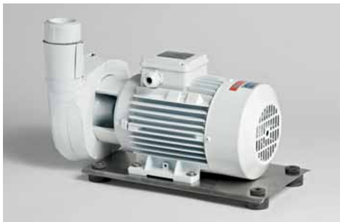
Art. 710 - Pompa acqua mare 0,125 HP Art. 711 - Pompa acqua mare 0,4 HP Art. 712 - Pompa acqua mare 0,5 HP Art. 713 - Pompa acqua mare 0,75 HP Art. 714 - Pompa acqua mare 1 HP Art. 715 - Pompa acqua mare 1,5 HP Sea water pumps for sea water circulation. Available in both single and three phase and double frequency. Pompe appositamente realizzate per la circolazione di acqua mare. Disponibili sia con alimentazione monofase che trifase ed a doppia frequenza.