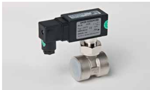
Art. 917 Flussostato 1" (602-603NT)