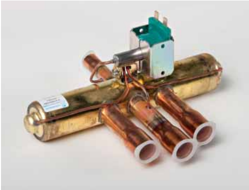
Art. 908 - Inversion cycle valve V2 with coil (HP 0,75-HP.1,2-HP.1,5-HP.2) Valvola inversione ciclo V2 completa di bobina (HP 0,75-1,2-1,5-2)