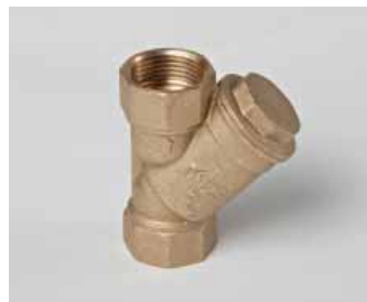
Art. 915 Water filter / Filtro acqua 1" (602-603NT)