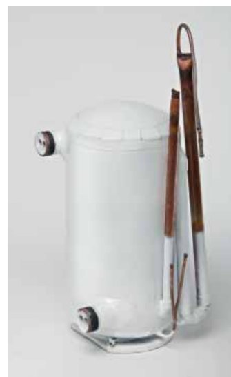
Art. 901 - 32500-39000 / (unit HP.2-HP.3) Art. 900/b - 65000-78000 / (unit HP.4-HP.5) Art. 903 - 10000-26000 / (HP.1-HP.1,5) Heat exchanger for fresh water. Scambiatore acqua dolce per centraline.